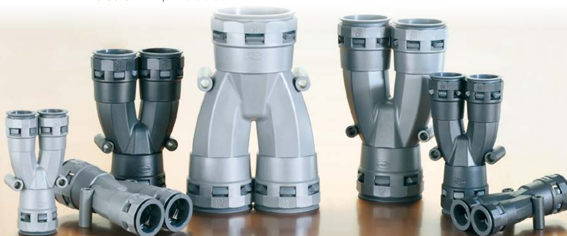
Dimensions in mm | Dimensions en mm